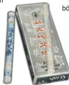
Üröm (Artemisia) szivarkák