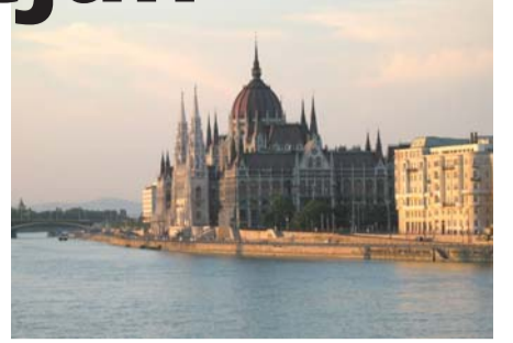
gyönyörű Balaton parton új szalonok nyitása tervezett.

És végezetül. Hamarosan a budapesti szalon működése nem „szóló” lesz Magyarországon. A